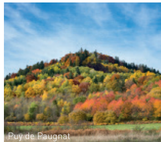
Puy de Paugnat

jusqu'aux premières maisons. Descendre à droite dans le village, puis tourner à gauche rue des Parceiraux. Suivre la rue principale jusqu'à la D16. Prendre à droite et rejoindre le départ.