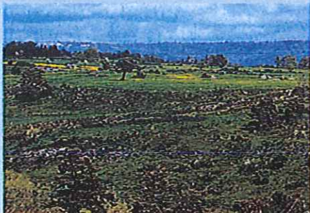
Plateau de Lair.

Niveau VTT : difficile. Du point 5 à l'arrivée, il y a 4 passages à franchir.