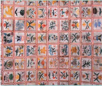
Voute de l'église de Cheylade.